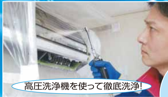
高圧洗浄機を使って徹底洗浄!